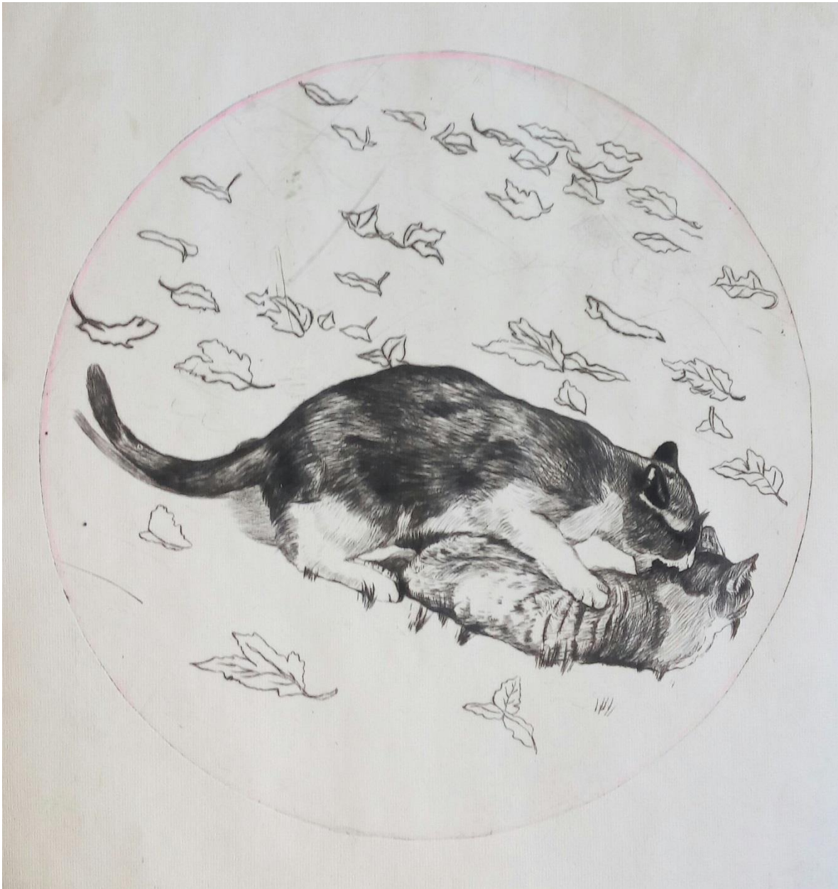
"Love, Hate, Love."

Se muestran tres ejemplos de un aproximado de 20 matrices trabajadas con diversa motivación temática, con la técnica de punta seca como eje central del proceso gráfico.